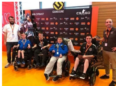
EUSKAL ENCOUNTER 2023